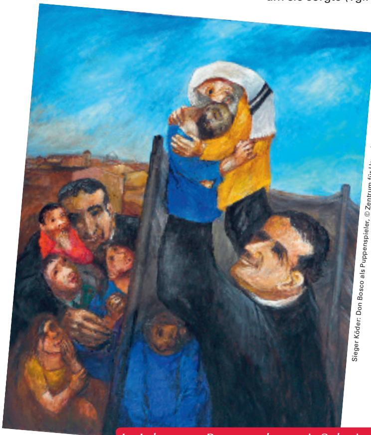
Sieger Köder: Don Bosco als Puppenspieler.